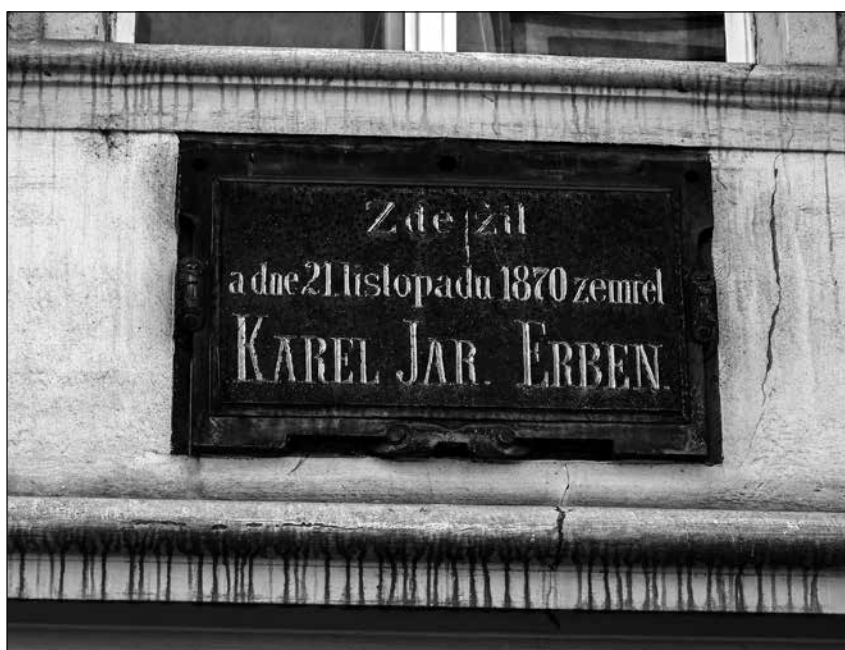
V Michalské ulici v Praze.

V tuzemsku totiž platí, že pokud nemá televizní stanice