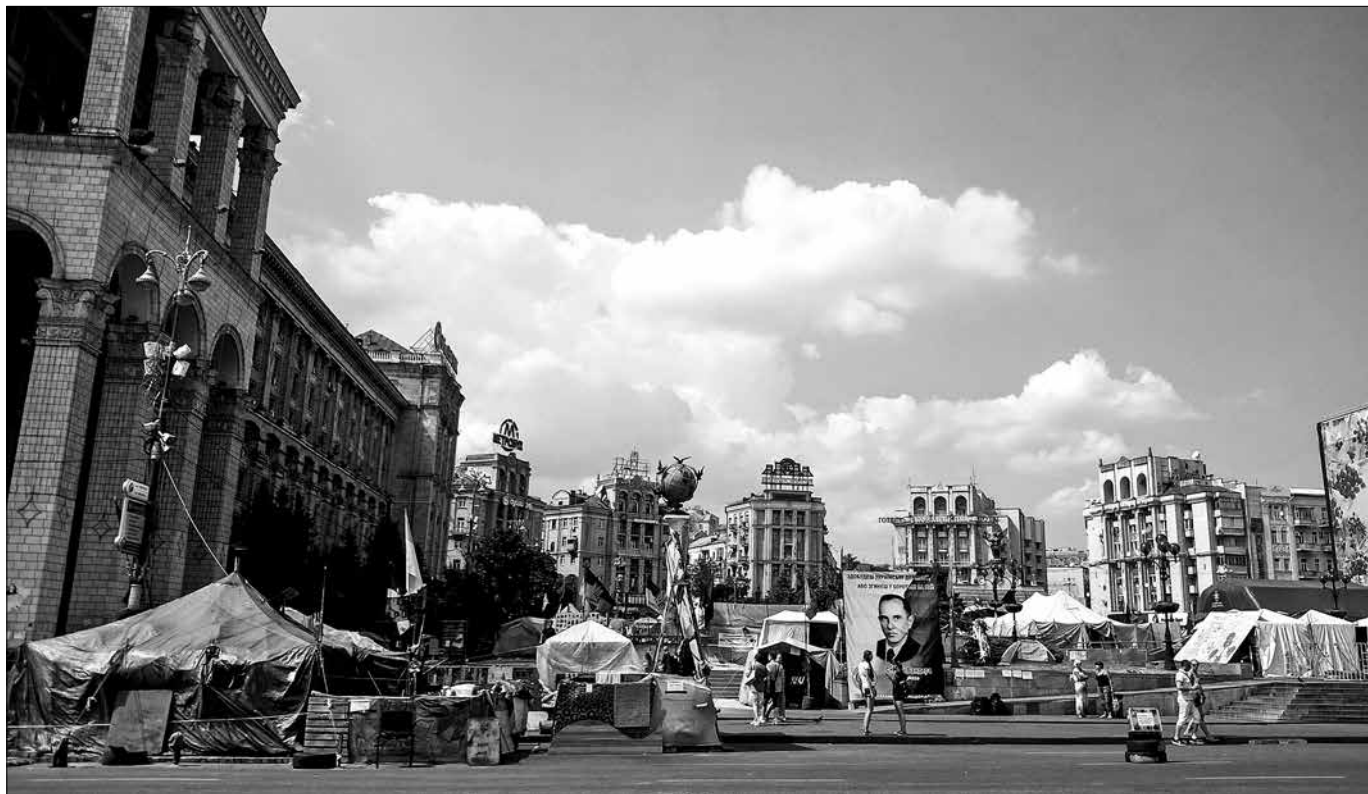
Zbytky stanového města na Majdanu v srpnu 2014.

Organizátory hnutí, které od 17. října „okupuje“ ulici Hruševského a jež se nazývá Vseukrajinskij zbir (Všeukrajinské shromáždění), jsou významné občanské iniciativy zabývající se bojem proti korupci a prosazováním reformem. Patří mezi ně mimo jiné takzvaný Automajdan (motorizovaná skupina, jež vznikla při protestech na přelomu let 2013 a 2014), organizace „Česno“, která dlouhodobě monitoruje nekalé praktiky ukrajinských poslanců včetně „knopkodavstva“ čili situace, kdy jeden poslanec