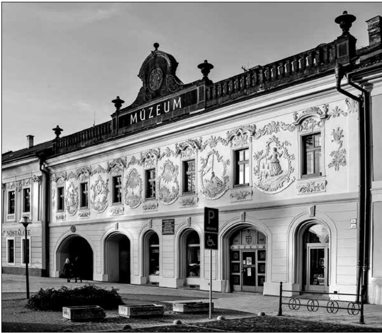
V bývalém Župním domě sídlí Spišské muzeum.