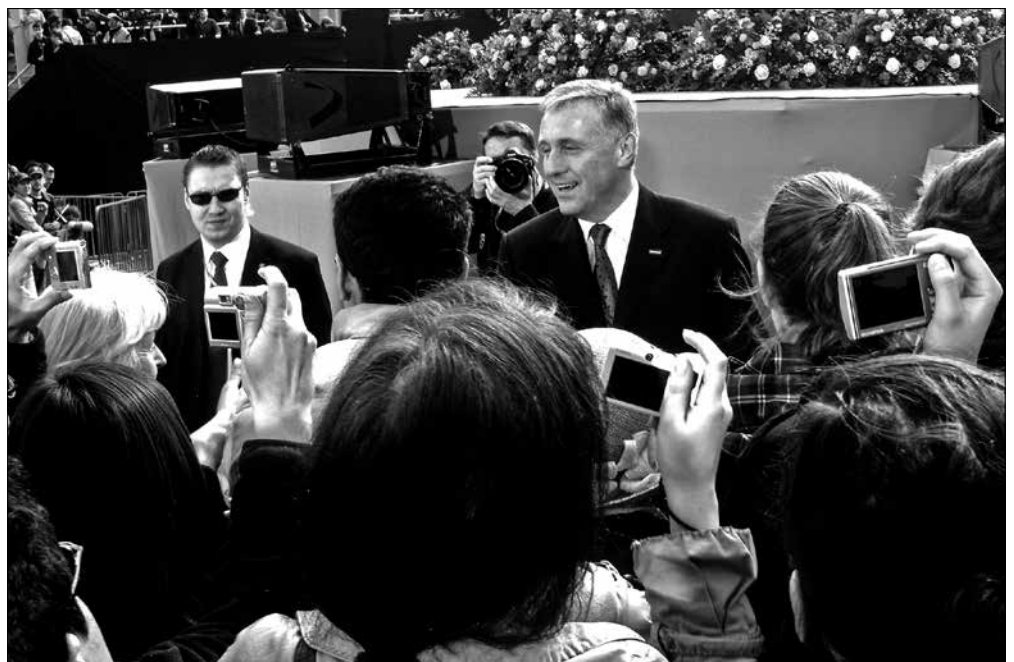
Jsem zpátky! Stýskalo se vám?