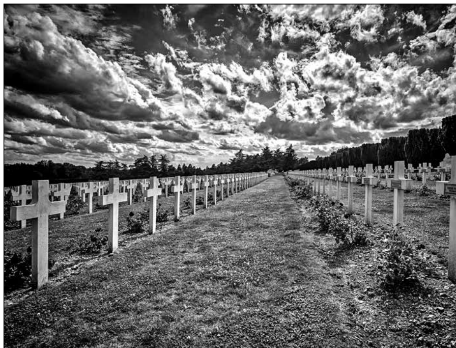
Velmocí válčily, lidé umírali. Hřbitov u francouzského Verdunu.

ekonomicky nejúspěšnější část podunajské monarchie. Rychlému hospodářskému růstu v relativně liberálním společenském prostředí Lieven připisuje prudký vzestup českého národního hnutí, jež provázal nebývalý rozvoj národní občanské společnosti – spolků, klubů a asociací.