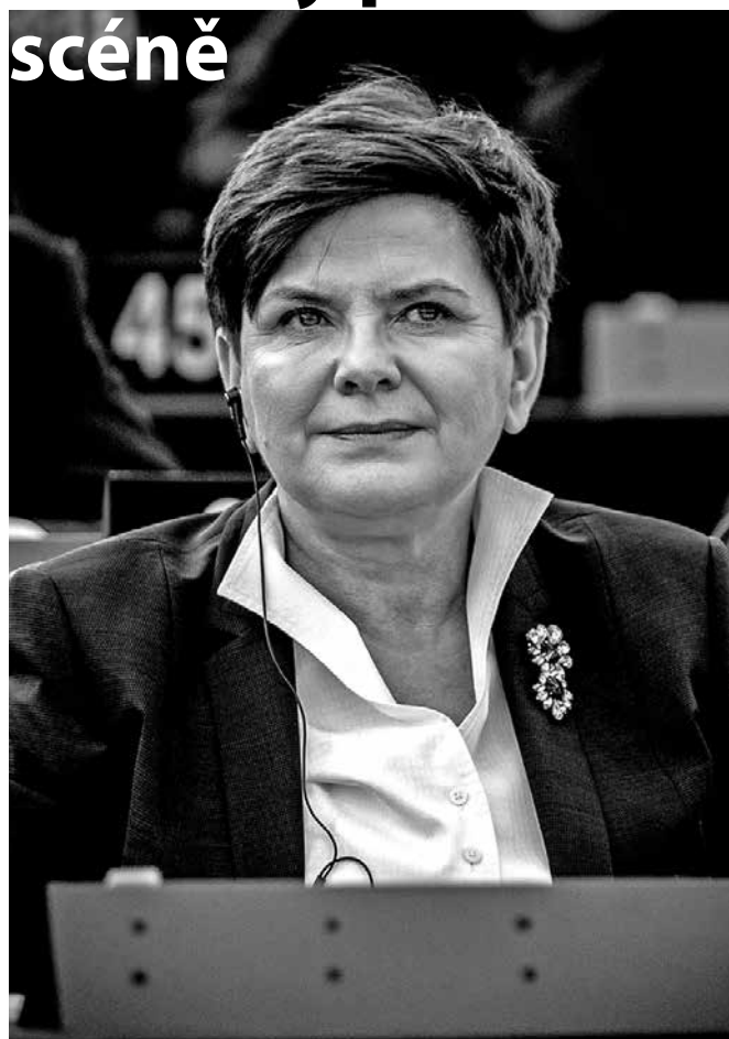
Beata Szydło je známá svou zálibou v brožích.

Černý protest – tak se označuje ostrý protest liberální části společnosti proti pokusům o zostření již nyní velmi restriktivního zákona o potrtech. Díky pouličním demonstracím několika stovek tisíc černě oblečených lidí se na podzim 2016 podařilo PiS přinutit, aby svou podporu návrhu zákona stáhlo. Lze ovšem zaslechnout hlasy, podle nichž bylo téma potratů vládní stranou využito