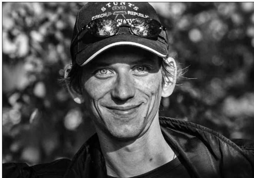
Režisér Jiří Strach zabodoval se svou pohádkou Anděl páně .

se tento žánr už vyčerpal. Na samém sklonku uvolnění, v roce 1968, se však objevil další pohádkový hit, který byl jedním velkým experimentem. Poměrně nečekaně za ním stál průkopník pohádkového žánru Bořivoj Zeman. V Šíleně smutné princezně riskoval obsazením neherců do hlavních rolí, vizuálním provedením z míšmaše histo-