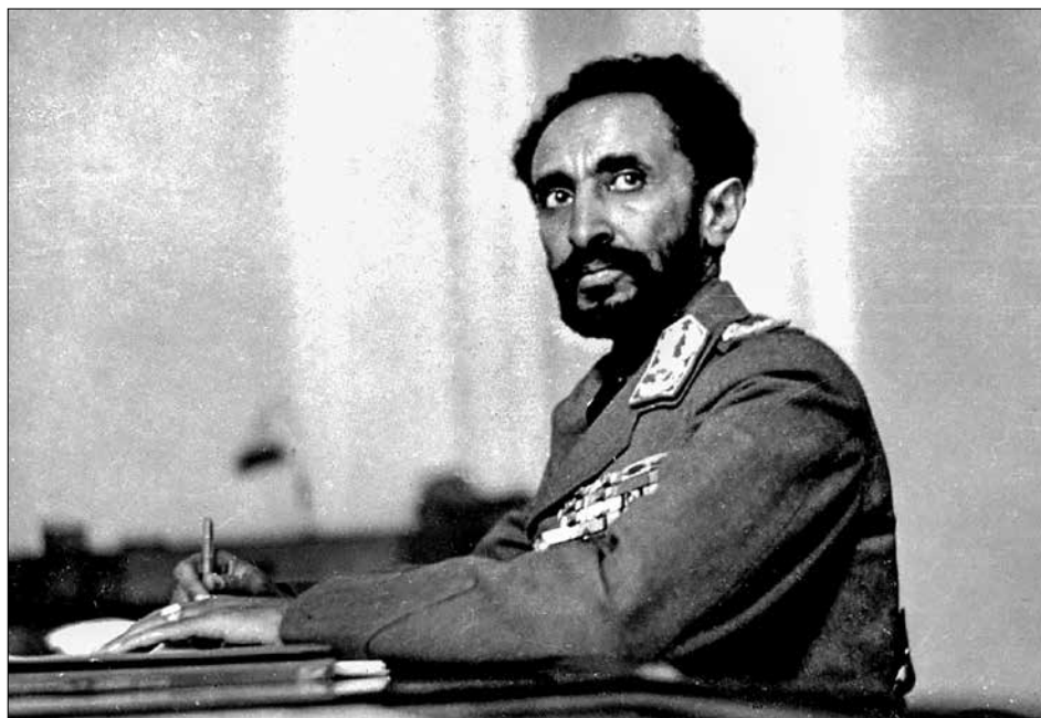
Etiopský císař Haile Selassie.

Mnozí historikové však kolonialismu přičítají i řadu pozitivních prvků, především pak zmiňují schopnost kolonizátorů udržet v daných oblastech řád a mír, zároveň ale také pronikání osvěty, eliminaci chudoby a další výtěžky západní civilizace. Jako emblematický příklad lze uvést státy, jako jsou Kanada či USA, které de facto vznikly díky evropskému ko-