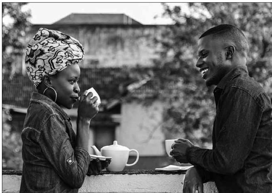
Vzpomínky na Afriku.