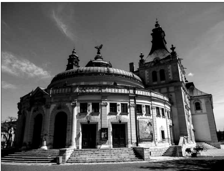
V secesní Redutě dnes najdeme Spišské divadlo.

Po válečných útrapách následovala budovatelská léta socialistické éry. Ke změnám došlo i na náměstí, kde vyrostl památník Slovenského národního povstání a pomník Milana Rastislava Štefánika nahradila socha zdejšího rodáka, československého kapitána Jána Nálepky. I když Štefánik ve městě pravděpodobně nikdy nebyl, bydlel tu jeho bratr a poslední roky života zde strávila i jeho matka. Všechny zásahy do podoby města včetně jeho centra nenarušily majestátnost velkého náměstí, kde se vedle rozsáhlých zelených ploch nacházejí dvě dominanty – evangelický kostel s půdorysem kříže a výše zmíněný