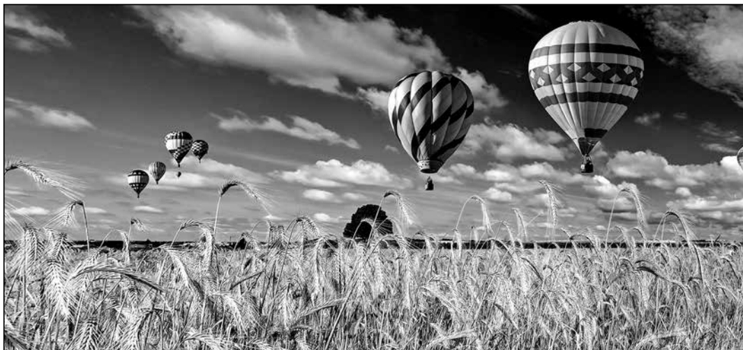
Málokdy to bývá na venkově taková idylka.

Anotace filmu: Téměř tříletý sběr materiálu na českém venkově, zkoumání toho, jakými tématy žijí zemědělci a podnikatelé v této oblasti, jak a proč fungují dotace, proč se pěstují některé plodiny více a jiné méně a proč v posledních letech ubylo chovů zvířete a jaké to má důsledky na produkci potravin, vedl ve výsledném střihu autory k zaměření se na roli Andreje Babiše, styl a důsledky jeho podnikání a následně i politických aktivit, které se stávají jedním z nejvíce určujících faktorů pro českou krajinu, podnikatelské prostředí a brzy nejspíš také pro celý stát. Film také využívá dlouhodobé práce řady novinářů v této oblasti a několik jeho scén přímo sleduje autory nedávno vydané knihy Žlutý baron Zuzanu Vlasatou a Jakuba Patočku při investigativní práci. Jedním z hlavních protagonistů filmu je moravský sedlák Bohumír Rada, který spoluzasvětil Andreje Babiše do zemědělského podnikání a pak se jejich cesty zásadně rozešly.