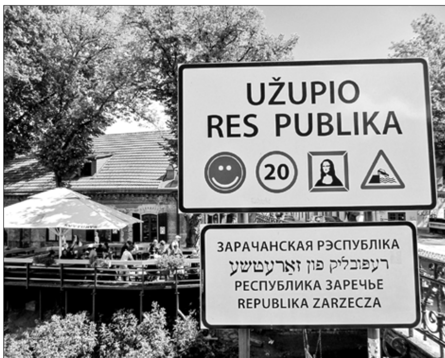
Foceno v litevském Vilniusu, kdysi polském Wilně. S identitou je to zde zkrátka složitější.