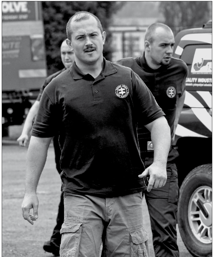
Kotleba končí jako župan, ale v parlamentu zůstává.

Nejpodstatnější zprávou župních voleb je skutečnost, že to občané ještě nezabalili a chtějí změnit politickou kulturu v zemi. Necelých třicet procent sice zrovna ne-