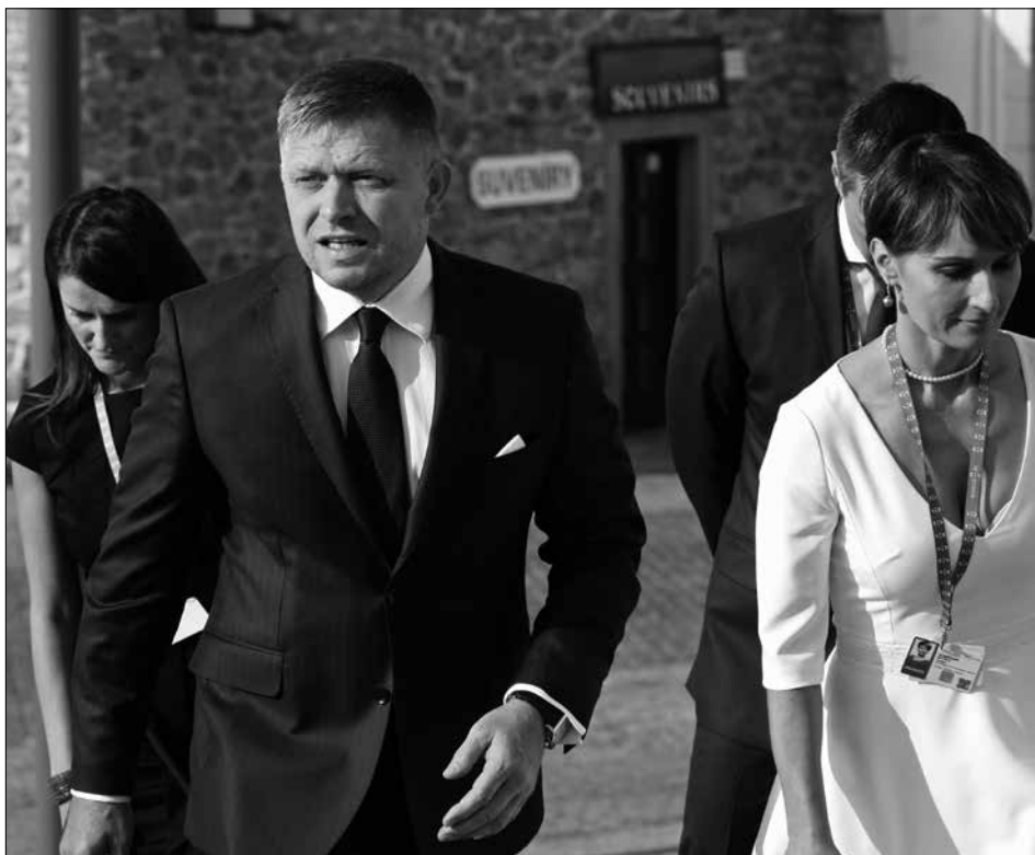
Robert Fico mívá naspěch, takže občas nestihne okomentovat volební výsledky.

Kotlebova extremistická Lidová strana Naše Slovensko (ĽSNS) zažila debakl, o kterém se jí zřejmě nezdálo ani ve zlých snech. Kotlebovci počítali s tím, že obsadí značnou část křesel v župních parlamentech, a rozšíří tak svoje politické teritorium. Jenže sám Kotleba, dosavadní ban-