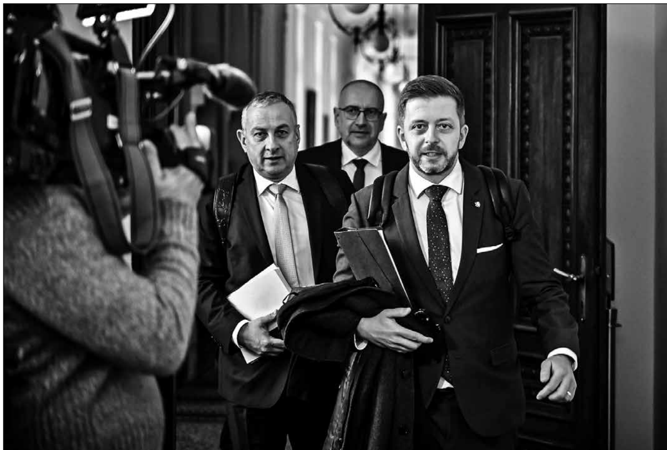
Trio ministrů za hnutí STAN přichází na vládu. V čele Vít Rakušan, za ním Jozef Síkela a úplně vzadu Mikuláš Bek.