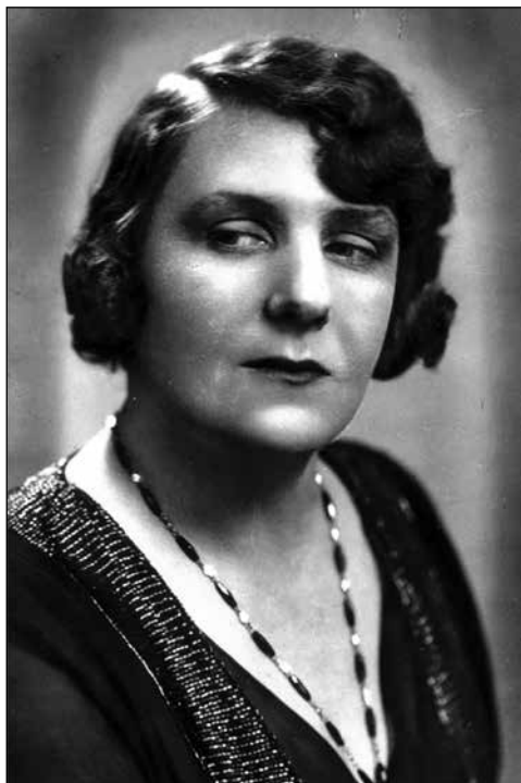
Věhlasná autorka i čtenářka Zofia Nałkowska.

Literární obrat nastal u Nałkowské po první světové válce, kdy začala více otevírat politicko-spo-lečenská témata, její psychologická próza získala všeobecnější rozsah a nezaměřovala se výhradně