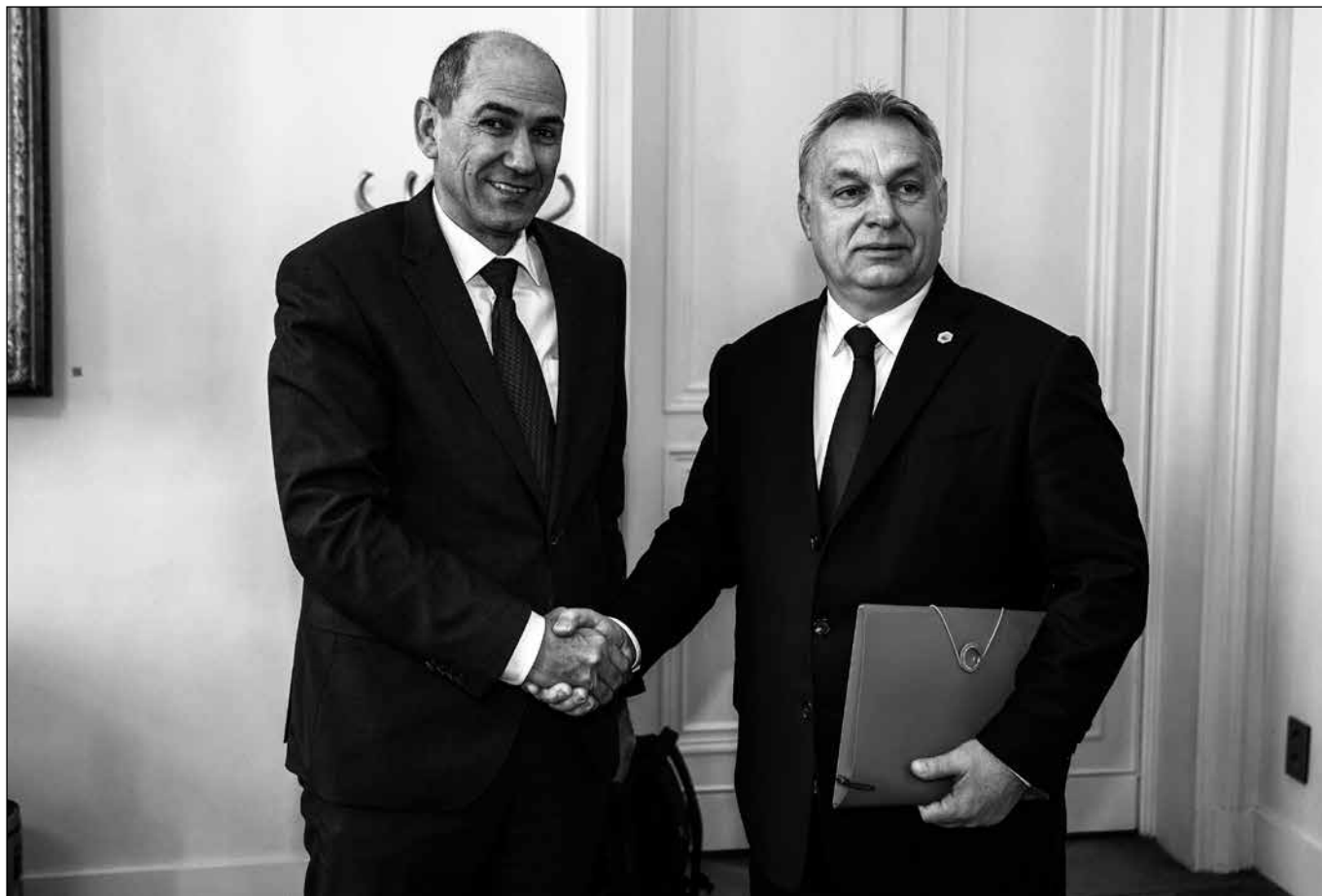
„Tak domluveno, Viktor.“ Janez Janša (vlevo) a Viktor Orbán.

2016. Iliberální politik záhy poté čelil obviněním z korupce a zneužívání moci, v roce 2018 potom s pomocí maďarských orgánů utekl za přítelem Viktorem do Budapešti a požádal tam o azyl. Makedonskými soudy tedy mohl být odsouzen pouze v nepřítomnosti a k výkonu trestu nikdy nenastoupil. „Se spojenci má člověk zacházet čestně,“ zhodnotil tehdy premiér Orbán, proč jeho vláda zmařila volný průběh spravedlnosti v balkánské zemi.